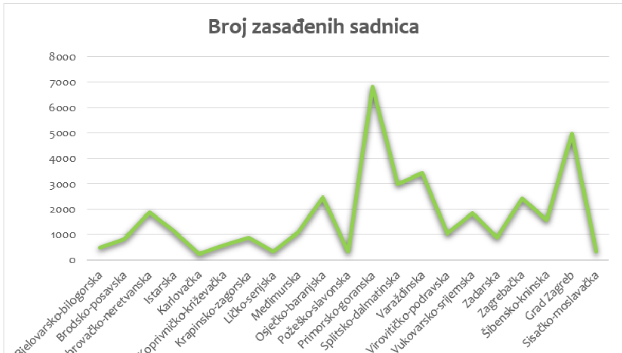
Sl. 2. Broj zasađenih sadnica po županijama

Županija u kojoj je tokom građanske inicijative zasađena najveća količina sadnica (gotovo 20 % od ukupnog broja) je Primorsko-goranska, gdje je na 82 lokaliteta ukupno zasađeno 6 838 sadnica, uglavnom na području Gorskog kotara. Na drugom mjestu je Grad Zagreb, gdje je, većinom na padinama Medvednice, ukupno zasađeno 4 980 sadnica. Na području Varaždinske županije, na 61 lokaciji, zasađena je ukupno 3 431 sadnica, a blizu 3 000 sadnica zasađeno je i u Splitsko-dalmatinskoj županiji. Više od 2 000 sadnica zasađeno je na području Osječko-baranjske i Zagrebačke županije (sl.2.).